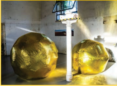
Hirt, Anika_sein inflatable 2016_22