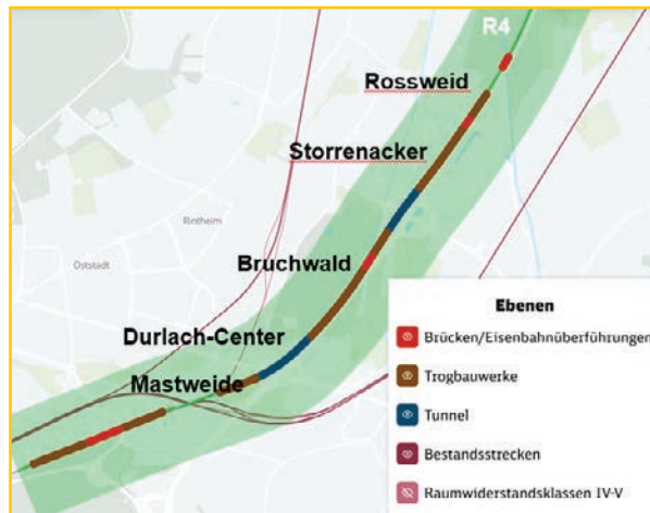
Vorzugsvariante R4 im Karlsruher Bereich bis Gbf

Im 15. Dialogforum vom 24.11.2025 hat die DB ihre Vorzugsvariante R4 bekannt gegeben. Diese Vorzugsvariante bündelt die beiden zusätzlichen Gütergleise ab Forst nach Süden mit der Bundesautobahn (BAB) A5 (westlich der A5 verlaufend) und endet im Karlsruher Güterbahnhof (Gbf), und dies formal, weil das