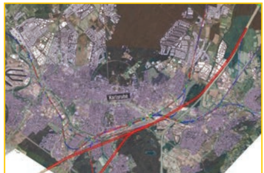
Von der DB geplanter Tunnel im Osten, Quelle: DB

Die Bürgervereine der betroffenen Stadtteile können bei der Vorzugsvariante R4 nicht akzeptieren, dass zwei zusätzliche Gleise in einer Überbündelung zusammen mit einer zukünftig auf acht Fahrstreifen zu erweiternden BAB A5 durch den Osten zwischen Karlsruhe-Ost und Durlach gelegt werden und damit die Wohnbevölkerung tags und nachts den europäischen Güterverkehr vor der Haustüre erdulden müsste, Gewerbegebiete betroffen wären sowie Naturreservate vernichtet würden. Die Bürgervereine fordern daher weiterhin die Untertunnelung wie oben aufgeführt.