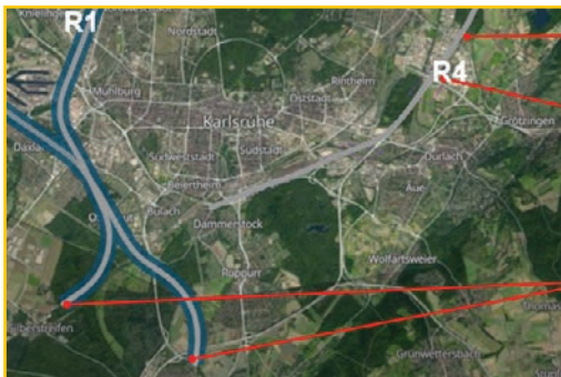
Variante R1 im Westen und R4 im Osten

Vor dem Hintergrund, dass nach Aussage der DB 90% der Güterzüge als Transitverkehr an Karlsruhe vorbeifahren, und die Betroffenheit im Karlsruher Raum extrem groß ist, hat der Gemeinderat bereits im Juli 2022 die Empfehlung beschlossen, den Karlsruher Bereich für den Güterverkehr komplett zu untertunneln . Aufgrund zahlreicher Betroffenheiten müsste der Tunnel nördlich von Grötzingen/Hagsfeld bis zur Anbindung der beiden Trassen südlich von Rüppurr (Trasse 4000) und südlich von Oberreut (Trasse 4020) reichen.