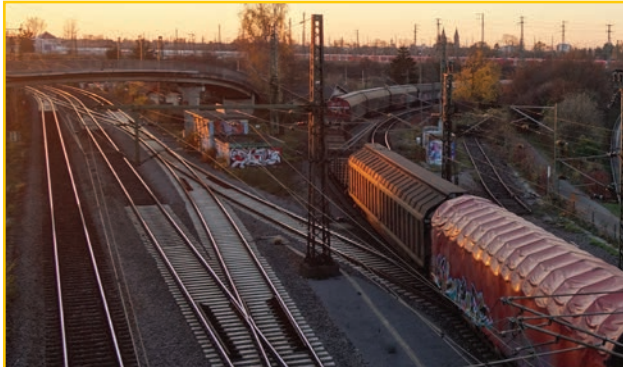
Durlach-Center an der Autobahn