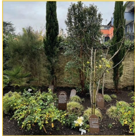
Bibelgarten im Winter

Der Bibelgarten der Gemeinde Zum Guten Hirten liegt noch im Winterschlaf, wird aber bald wieder erwachen und für Mensch und Tier eine Oase der Erholung sein. Mit dem Frühling kommt aber auch wieder viel Arbeit auf uns zu: Helfende Hände werden gesucht!