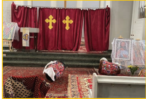
Äthiopischer Gottesdienst in unserer Kirche