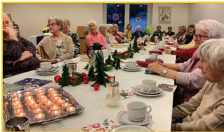
Treff 77