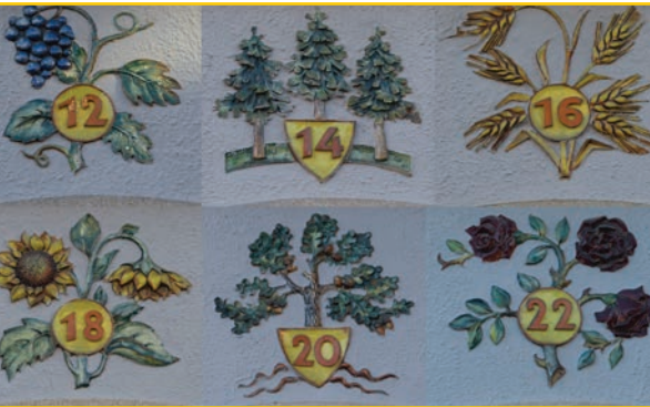
Schöne Hausnummern in der Oststadt

Überall in der Oststadt findet man tolle Kunstobjekte und Figuren: