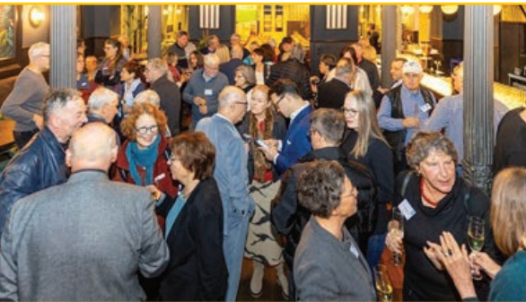
Viele Inspirationen

Wer an diesem Abend einen Platz ergatterte, durfte sich glücklich schätzen: Der Jahresauftakt 2026 des Bürgervereins Oststadt im Eat&Greet, dem ehemaligen Alten Schlachthof, war bis auf den letzten Stuhl gefüllt. Und was sich dann entfaltete, hatte gleich vier Höhepunkte – ein Programm, das zeigte, wie viel Energie, Wirtschaftskraft und Humor in einem Stadtteil stecken können.