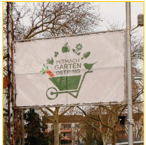
Mitmachgarten, Quelle: Gerhard Jordan

ernst und erlaubte bei nassem und kaltem Wetter kaum nennenswerte Aktivitäten. Einige Eifrige trotzten dennoch unbeirrt dem regnerischen Wetter und begannen bereits im kalten Februar damit, die eine oder andere Reparatur vorzunehmen, Müll aufzusammeln, die Stützen der Benjeshecke zu stabilisieren, Ziergräser zurückzuschneiden oder Nistkästen zu reinigen. Und außerdem konnten wir unser neues Banner aufhängen.