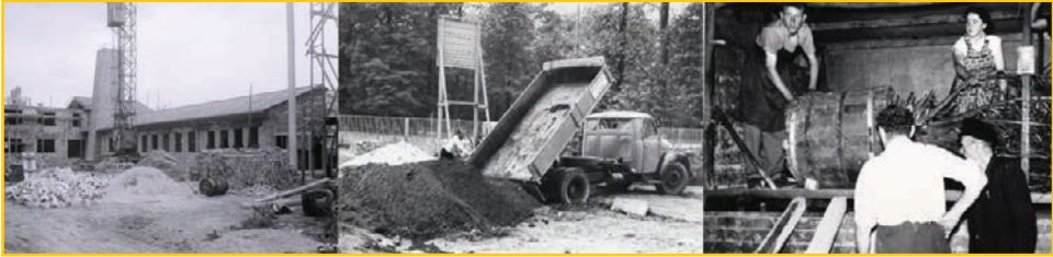
Neubau des Botanischen Gartens der TH 1956-58

vielen wissenschaftlichen Einrichtungen vernetzt. Ihre Forschungsergebnisse liefern wertvolle Beiträge zur nachhaltigen Lösung vieler Probleme der Landwirtschaft, die als Folge des Klimawandels immer drängender werden.