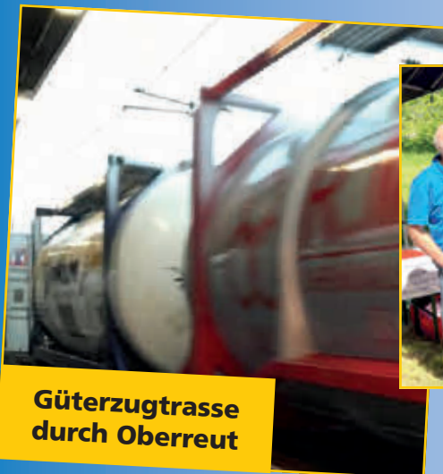
Güterzugtrasse durch Oberreut