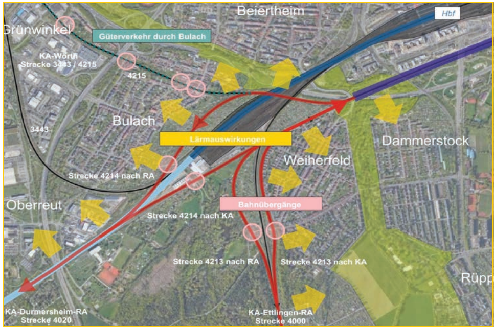
Die Planungslücke im Karlsruher Südern (die roten Gleise)