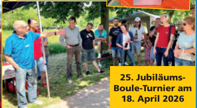
25. Jubiläums- Boule-Turnier am 18. April 2026