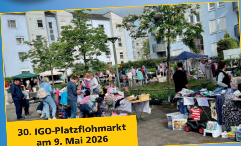
30. IGO-Platzflohmarkt am 9. Mai 2026