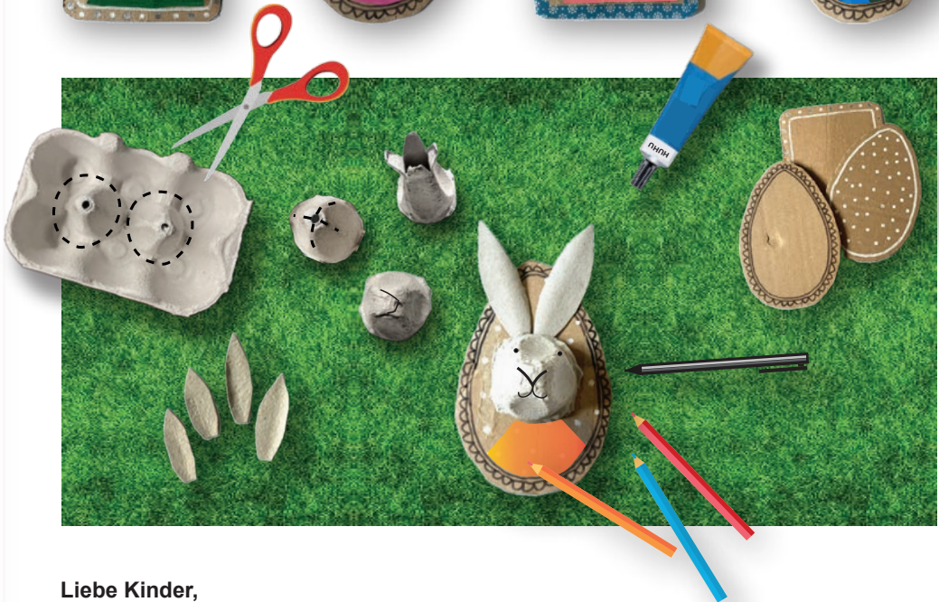
Gestaltung: Anne Däuper