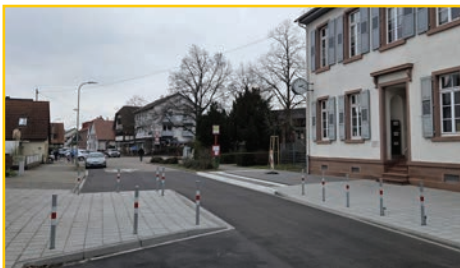
Fußgängerquerung Breite Straße

Im Zusammenhang mit dem Umbau der Haltestelle in der Breite Straße wurde nun endlich auch die seit langem geforderte Fußgängerquerung vor der Schülerhort umgesetzt. Durch die vorgezogenen Gehwege wird der Verkehr verlangsamt und die Sichtverhältnisse verbessert, so dass insbesondere die Schüler und Schülerinnen der Grundschule von einer höheren Sicherheit auf dem Schulweg profitieren.