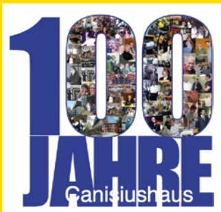
Grafik: Martin Sauter

2026 feiern wir auch 100 Jahre Canisiushaus! Dazu ist eine 84-seitige Festschrift erschienen. Sie kann zum Preis von 10 € beim Pfarrfest und bei Veranstaltungen im Canisiushaus erworben werden.