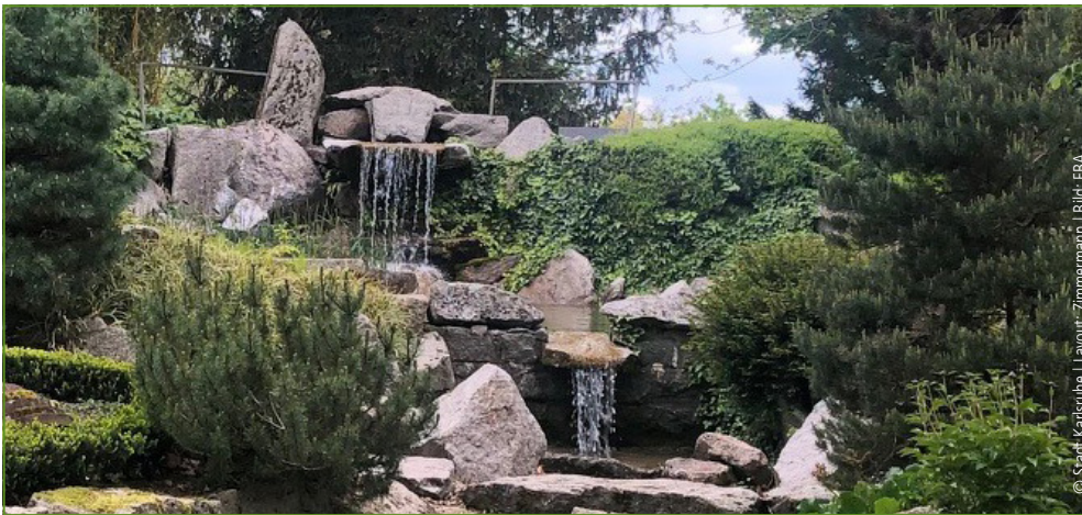
© Stadt Karlsruhe | Layout: Zimmermann | Bild: FBA