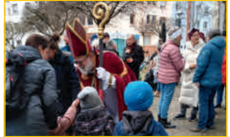
Nette Gespräche bei Glühwein, Gebäck und Kinderpunsch.

Wir möchten uns im Namen aller Kinder bei dem netten Nikolaus mit echtem Bart bedanken. Der Vorstand bedankt sich bei allen Besuchern, dem Nagelstudio am Kolpingplatz für die Bewirtung und den Eltern für die zahlreichen Spenden. Die Kinder freuen sich schon auf die nächste Nikolausfeier am 06.12.2025, die mit einem Programm gestaltet wird.