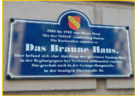
Tafel am „Braunen Haus“.

(vb) „Braunes Haus“, Ritterstraße 28-30, Amtsgebäude, viergeschossig, mit zwei Toreinfahrten und zugehörigen Hinterhäusern, Nebengebäuden und Garagen, ursprünglich zwei Mietwohnhäuser, 1866 und 1886 von G. Kuentzle, um 1930 unter einheitlicher Fassadengestaltung zu einem Gebäude zusammengefasst, 1933-1945 Gauamt der NSDAP Baden, 1943-44 auch Nutzung durch die Geheime Staatspolizei (Gestapo) mit Verhörzellen im Keller Geb. Nr. 30, nach Kriegsende polizeiliche Nutzung. Erhaltene Luftschutzeinrichtungen. (Kulturdenkmale Karlsruhe)