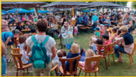
Hirschbrückenfest 2024 – Kinderbücherlesung.

Wir freuen uns auf Ihren Besuch und schöne Stunden mit Ihnen.