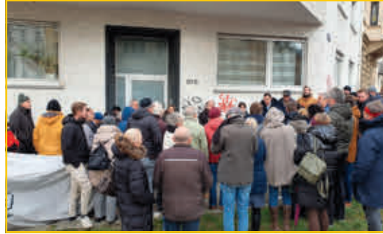
Über 60 Bewohner haben kräftig diskutiert.

Der Bürgerverein hat eigene Vorschläge und Lösungen vorgestellt und erwartet von den Verantwortlichen deren Umsetzung. Unsere ergänzten Vorschläge und Lösungen senden wir Ihnen in der Anlage zu.