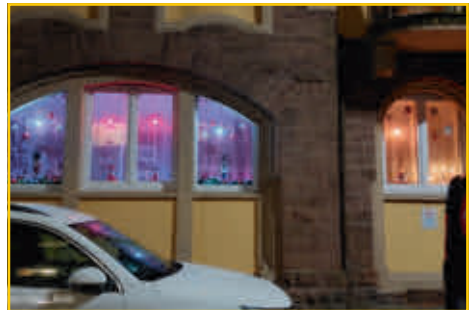
Südweststadt mit der schönsten Weihnachtsdeko 2024.