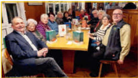
Weihnachtsstammtisch mit Geschenken im „Alten Brauhof“.

Ort: „Alter Brauhof“, Beiertheimer Allee 18a, 76137 Karlsruhe