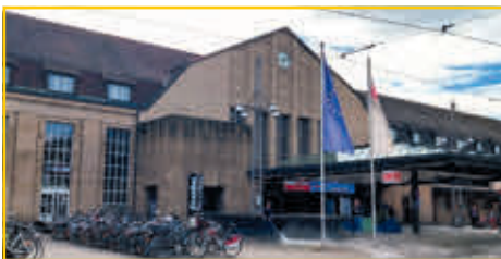
Neue Fahrradstellplätze am Hauptbahnhof.

Rechts vom Haupteingang ist noch Platz für Fahrradboxen oder Fahrradstellplätze. Am Ende der Bahnhofstraße und der Straße Am Stadtgarten könnten Fahrradboxen aufgestellt werden. Weitere Fahrradabstellplätze sind neben der Zoo-Mauer mit schrägen Fahrradständern möglich (Titelbild).