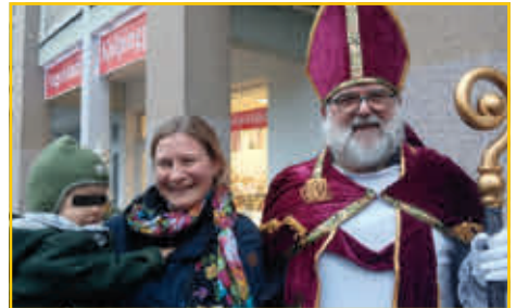
Die Kinder freuten sich über den Nikolaus.