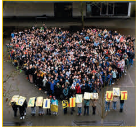
GGK – wir sind bunt.

Zunächst wurde das Thema an zwei Tagen in zahlreichen und sehr verschiedenen Workshops kreativ erlebt. Eltern, Externe, Schülerinnen und Schüler sowie Lehrerinnen und Lehrer boten über 50 Workshops an, in denen man sich auf ganz unterschiedliche Art und Weise mit Aspekten zu „Gemeinsam sind wir Vielfalt“ auseinandersetzen konnte. Neben Tanz, Film, Theater und Diskussion gab es auch Bauen, Spielen und Lesen sowie