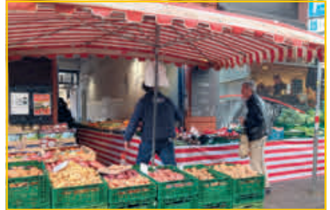
Obst und Gemüse in der Südweststadt.

(red) In Karlsruhe gibt es mehrere große Wochenmärkte mit unterschiedlichen Angeboten. Der Bürgerverein versucht seit einigen Jahren, interessierte Betreiber für einen Markt auf dem Kolpingplatz zu gewinnen. Wegen mangelnden Interesses an dieser Idee wurde sie nicht realisiert. In der Südweststadt findet seit einigen Jahren jeden Samstag von 7:30 bis 13:00 Uhr ein besonderer Wochenmarkt statt. In der Klauprechtstraße 25, vor dem Eingang der Metzgerei Brath, gibt es ein großes Angebot an frischem Obst und Gemüse. Dieses Angebot erspart unseren Mitbürgerinnen und Mitbürgern den weiten Weg zu den Wochenmärkten in der Innenstadt.