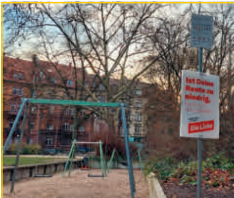
Wahlwerbung auf dem Spielplatz.