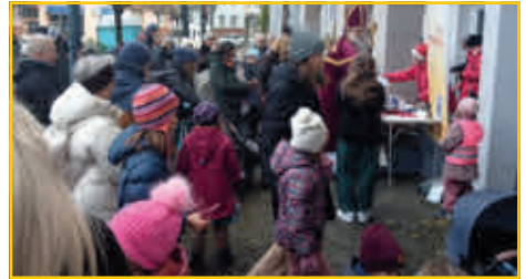
Viele Kinder auf dem Kolpingplatz.