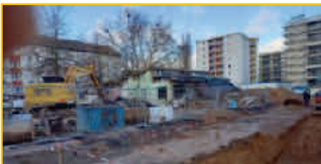
Abbruch der letzten Gebäude des Staudenplatzes

Eingeladen wird jetzt von der Sozial- und Jugendbehörde und vom Stadtjugendausschuss Karlsruhe, um im Zuge der Fertigstellung der neuen Wohnbebauung im Rintheimer Feld frühzeitig zu besprechen, ob und wie ein gutes Miteinander mit den neuen Mietern, vor allem junge Familien, aktiv gestaltet werden könnte. Fragen zu Auswirkungen auf den Stadtteil und die bestehenden Institutionen werden erörtert genauso wie Überlegungen zu Bedarfen der neuen Mieter werden angestellt. Bei diesem Austauschtreffen wird der Bürgerverein aktiv dabei sein.