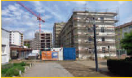
Baufortschritt April 2024

Anhand der Fotos soll der Werdegang der Baumaßnahme aufgezeigt werden.