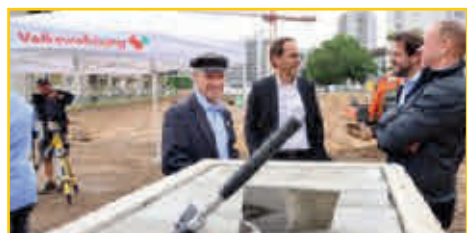
Grundsteinlegung Juli 2023.

die Bebauung im Rintheimer Feld hat jetzt doch schnell Form angenommen. Gerade erst im Sommer 2023 wurde der Grundstein für den Bereich nördlich der Heilbronner Straße gelegt und schon wird wegen der neuen Mieter im Februar ein Treffen angesetzt, wie ein gutes Miteinander mit den neuen Mietern, vor allem junge Familien, aktiv gestaltet werden könnte.